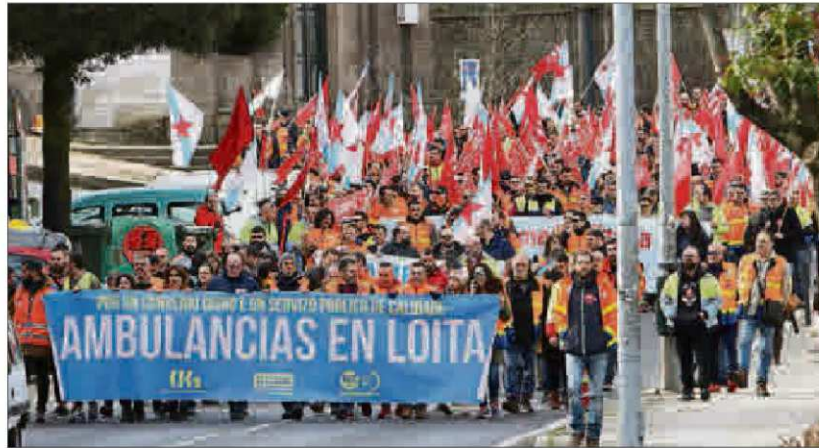
Manifestación el pasado 20 de febrero en Santiago de los trabajadores de ambulancias.

Desde la Federación Galega de Empresarios de Ambulancias destacan que el preacuerdo, firmado en la madrugada del martes en el Consejo Galego de Relacións Laborais tras siete horas de negociaciones y que tendría vigencia hasta 2022, recoge un "importante incremento salarial y mejoras sociales", sintetizados en incrementos salariales que sumarán un 12,5% desde 2022 a los que se añadiría una tercera paga extra de idéntico importe a las dos ya existentes, la percepción del "mismo salario en vacaciones que en el resto del año" o un pago de regularización en 2020 de 500 euros brutos.